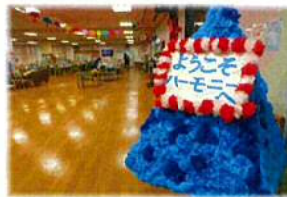
⇐ テイサーサービスホール 皆様の一番目に付く正面玄関入口には道や塗り絵が飾ってありますがホールも季節ごとの飾りつけに変えています