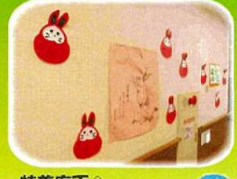
特養廊下↑ だるま兎が可愛い♡