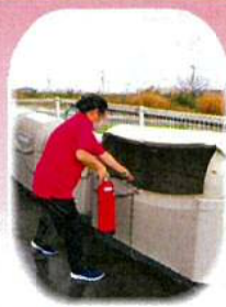
消火器を持って初期消火開始!