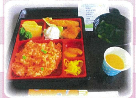
季節のお弁当 『ピクニック弁当』