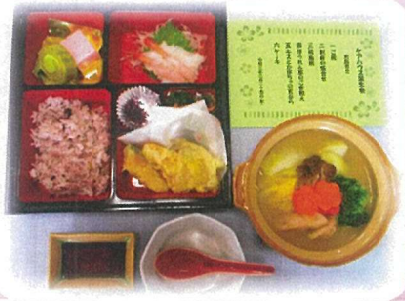
ケアハウスお誕生会