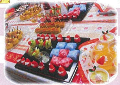
クリスマスおやつバイキング