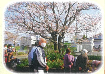
お日様ポカポカ。 体も芯から温まるばい!