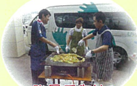
職員手作りの 焼きんばです