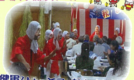
健軍ひよっこ・なかよし会