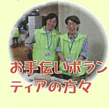
お手伝いボラン ティアの方々