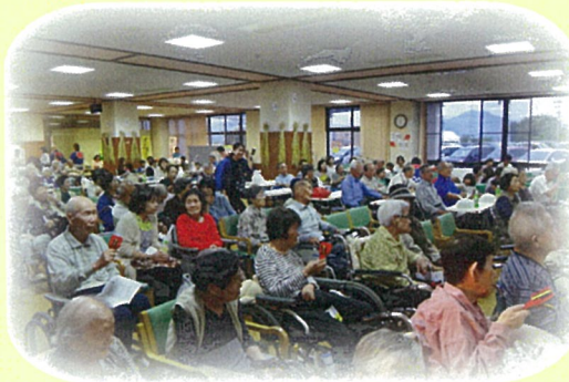
ハーモニー職員バンド

秋祭りにご参加頂きましたご家族及び地域のみなさま、また、ご協賛・ご協力頂いたみなさま、誠にありがとうございました。おかげさまで今年も大盛況のうちに終わる事ができました。