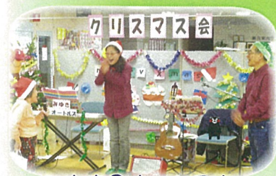
みゆき&おーとるず

各部署、工夫を凝らし賑やかなクリスマス会を 開催しました♪ 今回も、たくさんのボランティアの方に来て頂 き、ありがとうございました(*^^*) 皆さん楽しいクリスマス会を過ごされました♪