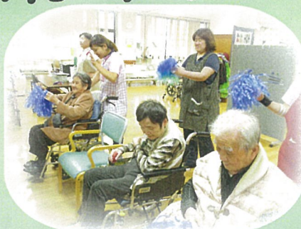
おかしかね〜 楽しかね〜