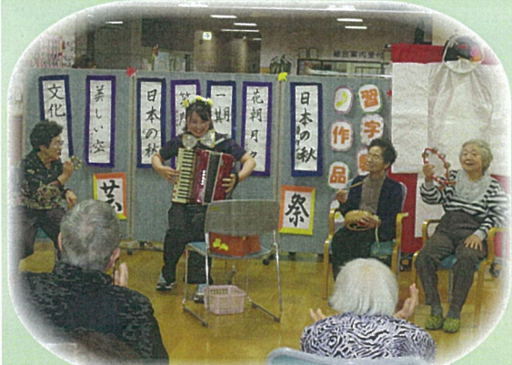
結成 ハーモニー合奏団！