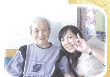
お塚さんが面会に 来られました