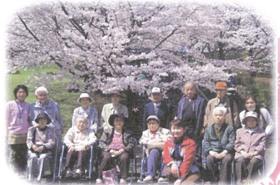
サクラを見ながらのお弁当は格別!!