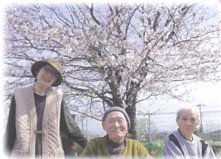
サクラも笑顔も綺麗ですわね♪