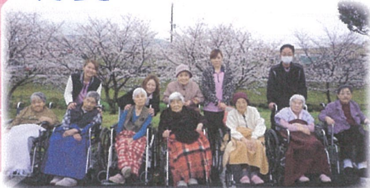
サクラの前で はい！チーズ