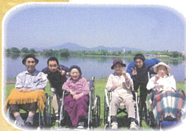
江津湖公園内を散歩 してきました