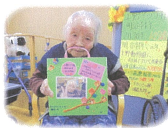
職員手作りの 誕生日プレゼント