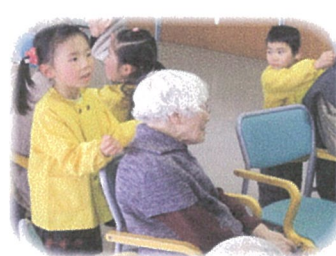
おばあちゃん ずっと元気ですね