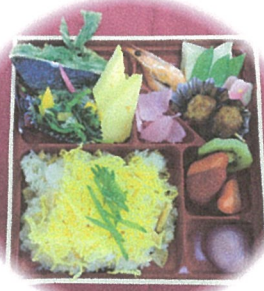
美味しい 手作りお弁当を 持って行きました