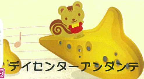
デイセンターアンダンテ