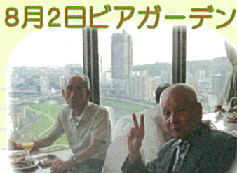
8月2日ピアガーデン