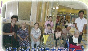
パスハイク(カラオケツアー)