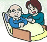
オイルマッサージ実践