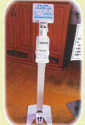
足踏み式消毒液スタンド