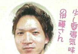
作品も本人も格好いんです